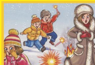
Петарды - опасны не играй с ними