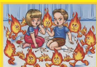
Спички детям не игрушка