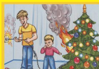
Не используй сломанные гирлянды