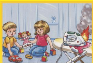
Не оставляй уют без присмотра