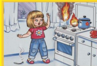
Будь с плитой очень осторожен